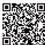
LINE アカウント登録用