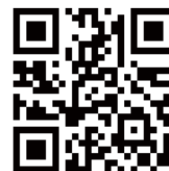
メールアドレス登録用